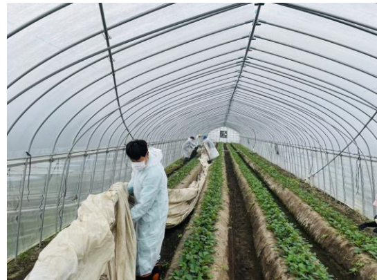
「研修中の様子 横田農園」

彩の国さいたま人づくり広域連合では、市町村職員の意識改革及び視野の拡大を図ることと、専門職や専門人材間の情報共有や人的ネットワークの構築を図ることを目的として、人材交流事業を行っています。その一環として、民間企業への職員派遣研修や専門職意見・情報交換会を実施しています。