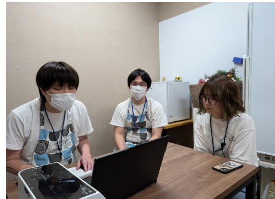
「研修振り返りの様子 温泉道場」

実地での研修後、研修効果の定着、研修生同士の交流・情報共有を目的として、12月16日にフォローアップ研修を実施いたしました。