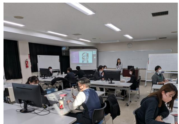
「フォローアップ研修の様子」