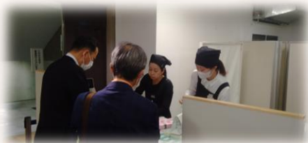
首長訪問の様子 ◀ 桶川市長