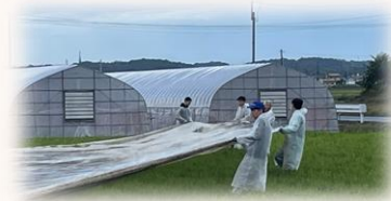
ビニールの撤去作業