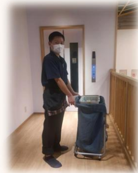
リネン業務の様子

・サービス業においては、お客様にとって快適な場、利用しやすい場をつくるということも業務の重要な要素の一つであるのだなと思いました。物販では商品の補充、温泉では水質検査と館内清掃がこまめに行われていたことはもちろん、接遇の面ではスタッフの方の視野の広さも印象に残っています。お客様への迅速な声掛けや、問い合わせに対するその後を予測した案内の仕方など、お客様が利用しやすい場をつくる対応について学ぶことができました。